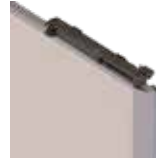
Guide haut à 2 roulettes + amortisseur

Equipe de série toutes les portes à partir de 551 mm de largeur.